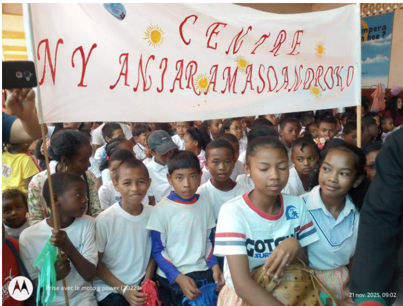
Journée des droits des enfants